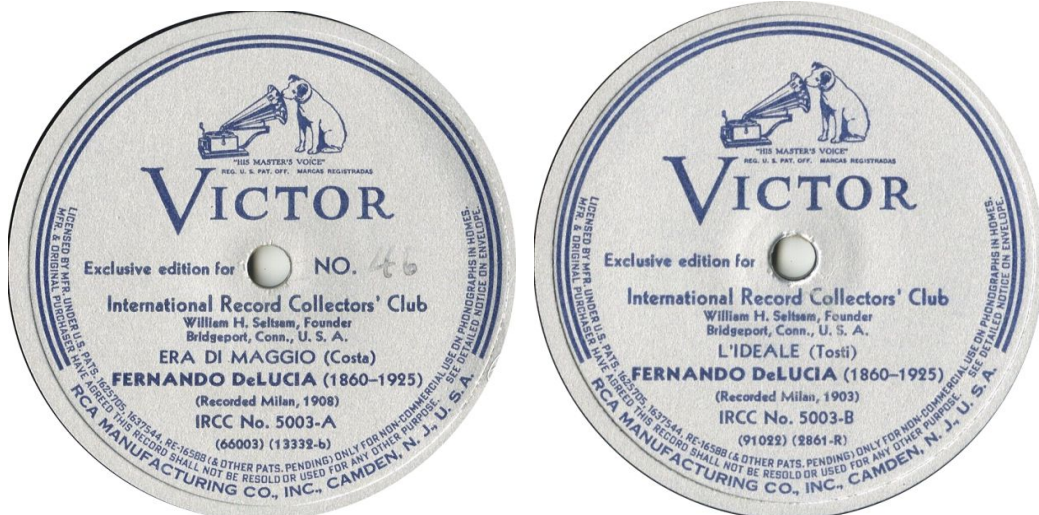
Wrong year of recording on both labels